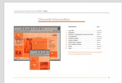
Auszug aus dem Styleguide der Winterthur Versicherungen