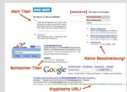
Bild 1: Häufige Fehler in der Trefferdarstellung. Worin liegen die Ursachen?