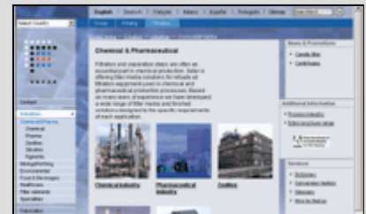
Sefar-Gruppe nach Beratung und Launch