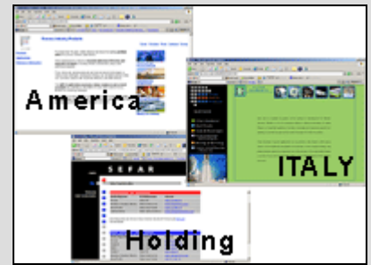
Sefar-Gruppe vor 2004