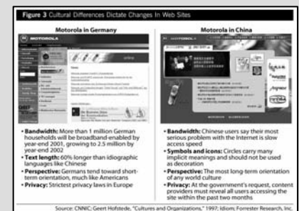
Asia vs. Europe, © Forrester, Research by namics ag